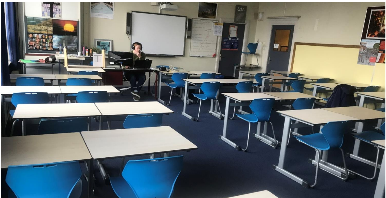
Lesgeven tijdens de COVID-19-pandemie. (Foto: C&M Landstede Groep).

Het primaire proces is steeds beter in beeld en het gesprek hierover versterkt de kwaliteitscultuur. Over het algemeen bezoeken steeds meer collega's lessen bij elkaar, geven collega's elkaar steeds meer feedback en hebben docenten met elkaar intervisie. Nog niet bij alle scholen is dit gemeengoed. De kijkwijzer die scholen hiervoor als kwaliteitszorginstrument gebruiken, is de digitale observatietool. Deze tool heeft geholpen de juiste gesprekken te voeren om 'het elke dag beter te doen'