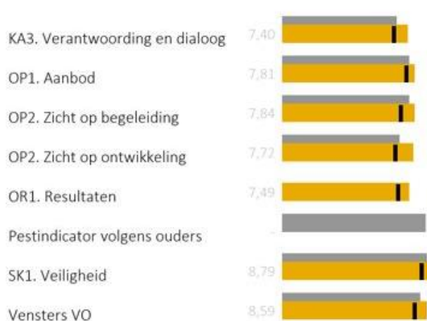
Figuur 6 Venster volgens ouders (leerjaar 3).