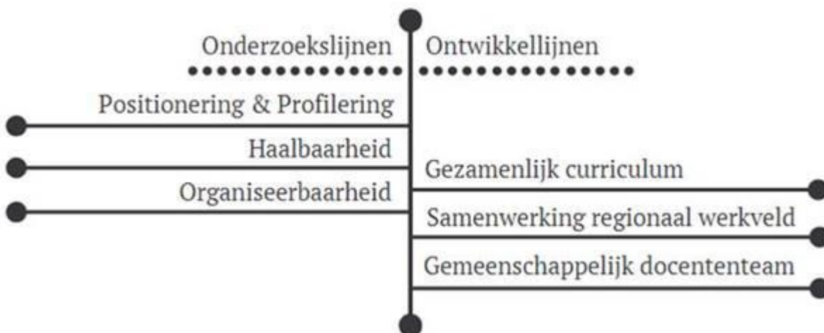
Figuur 5. Doorlopende leerlijnen

De gehanteerde twee projectlijnen zijn schematisch weergegeven in Figuur 5.