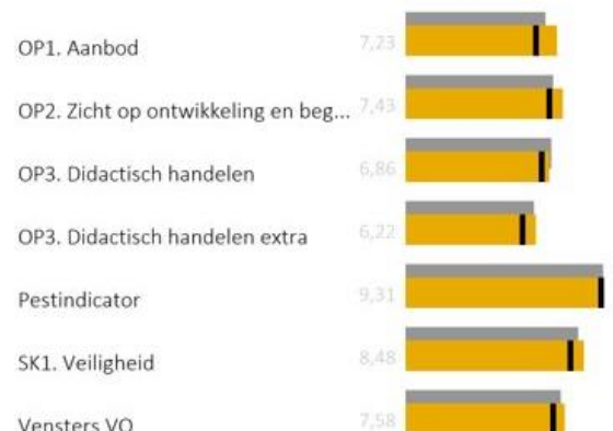
Figuur 11. Vensters volgens leerlingen (leerjaar 3)

Figuur 10 en Figuur 11 geven de uitslag weer van tevredenheidsonderzoeken onder ouders en leerlingen in 2020 van het Vechtdal College te Ommen. De enquêtes zijn afgenomen in 2020 en zijn door respectievelijk 46,7% van de ouders en 67,5% van de leerlingen ingevuld.