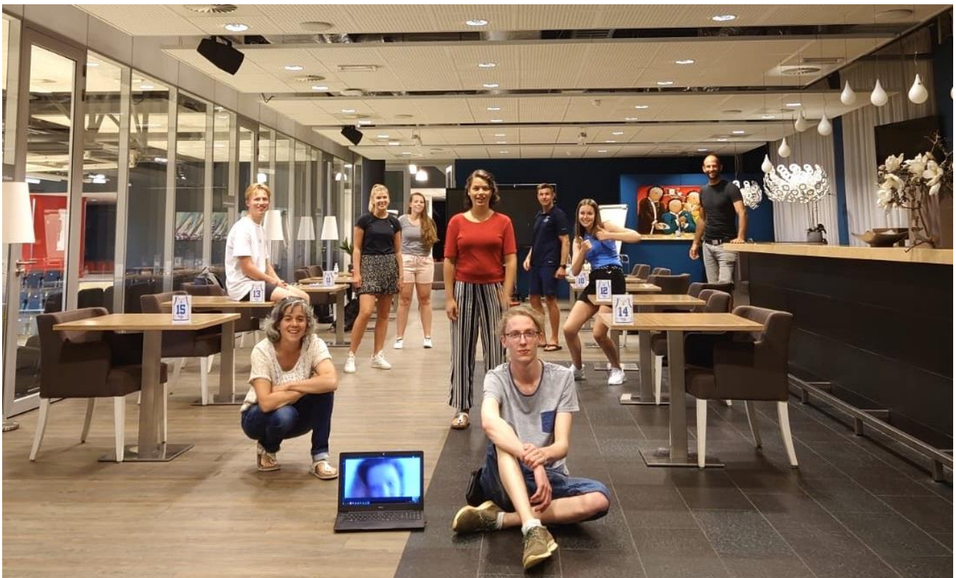
Jaarafsluiting met inachtneming van COVID-19-voorschriften.

Met het Strategisch opleidingsportfolio VO wil het College van Bestuur komen tot een interne verkenning vanuit scholen waaruit blijkt in hoeverre de gekozen profilering van de school zich verhoudt tot de demografie. In 2021 zal het Strategisch opleidingsportfolio VO verder worden uitgewerkt.