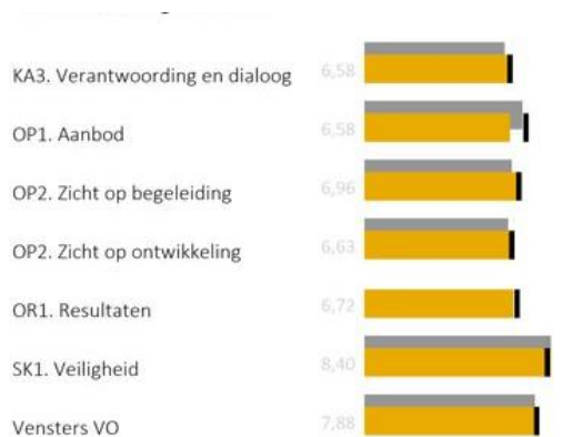
Figuur 10. Vensters volgens ouders (leerjaar 3)