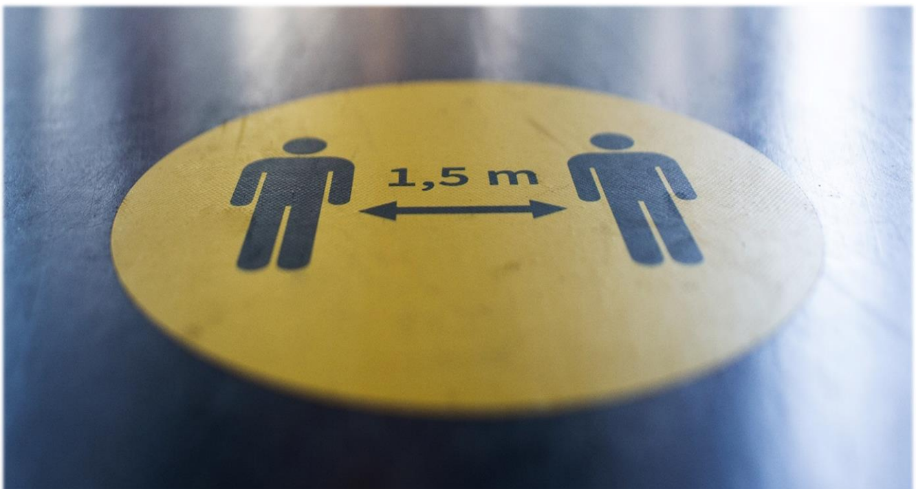
Bewegwijzering in de schoolgebouwen volgens RIVM-voorschriften COVID-19: houd anderhalve meter afstand.

De resultaten en conclusies van alle onderzoeken zijn gebundeld.