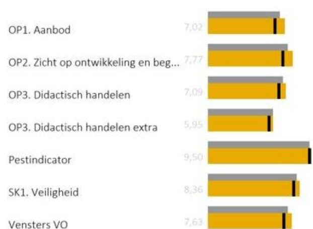
Figuur 9. Vensters volgens leerlingen (leerjaar 3).

Figuur 8 en Figuur 9 geven de uitslag weer van tevredenheidsonderzoeken onder ouders en leerlingen in 2020 van het Vechtdal College te Hardenberg. De enquêtes zijn afgenomen in 2020 en zijn door respectievelijk 32,4% van de ouders en 38,4% van de leerlingen ingevuld