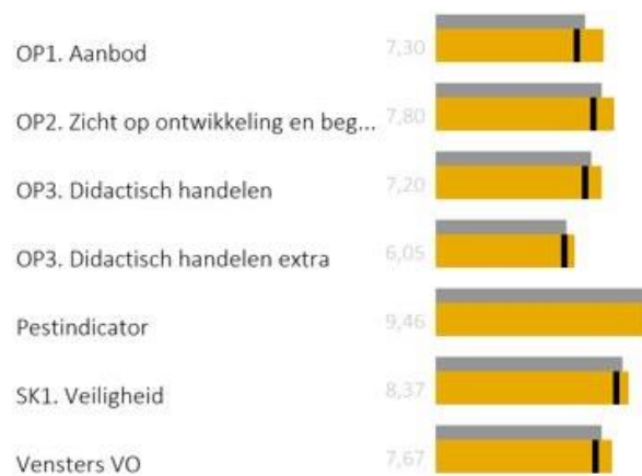
Figuur 7. Venster volgens leerlingen (leerjaar 3)

Figuur 6 en Figuur 7 geven de uitslag weer van tevredenheidsonderzoeken onder ouders en leerlingen van het Vechtdal College te Dedemsvaart. De enquêtes zijn afgenomen in 2020 en zijn door respectievelijk 32,1% van de ouders en 87,7% van de leerlingen ingevuld.