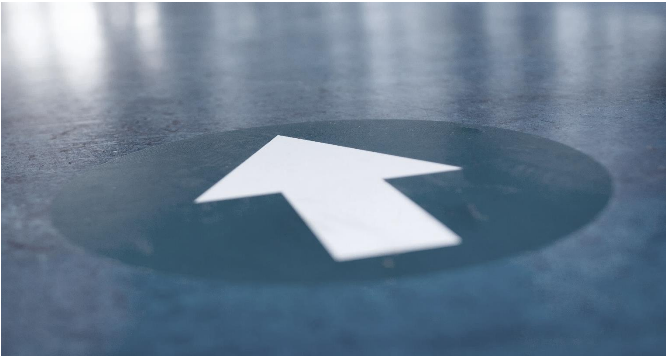
Bewegwijzering in de schoolgebouwen volgens RIVM-voorschriften COVID-19: looprichting. (Foto: C&M Landstede Groep).

Binnen Landstede Groep heeft OIDS (Opleiden In De School) een vaste plek gekregen en daarmee ook een vaste plek op het gebied van professionalisering van docenten. Er is veel belangstelling vanuit docenten om deel te nemen aan de cursus voor vakcoaches die samen met Christelijke Hogeschool Windesheim wordt verzorgd. Gedurende het schooljaar 2019-2020 bood Stichting Vechtdal College aan totaal 63 studenten een stageplek aan.