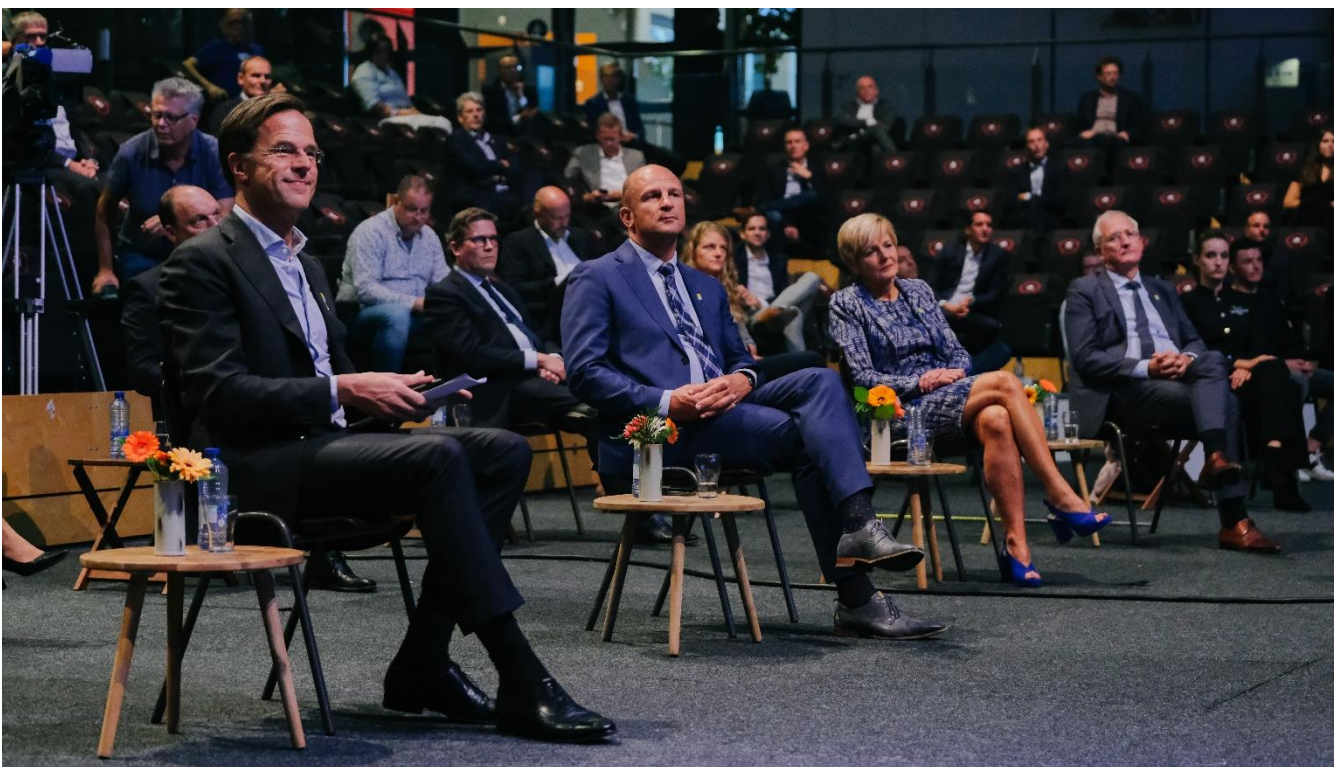
Opening van het schooljaar in aanwezigheid van minister-president Mark Rutte.

Landstede Groep is een onderwijsinstelling met scholen zowel in het voortgezet onderwijs als in het middelbaar beroepsonderwijs. Onderdelen in het jaarverslag, met name in de algemene delen zoals hoofdstuk 1, 5 en 6, kunnen voor zowel het vo als het mbo gelden. Daar waar het specifiek over het vo-onderwijs gaat wordt over leerlingen gesproken. Wanneer informatie over studenten wordt gegeven, met name in hoofdstuk 3, betreft dat de mbo-scholen of stagiaires van hbo-scholen die de stage binnen het vo- of mbo-onderwijs van Landstede Groep volgen.