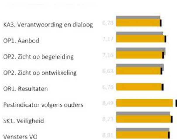
Figuur 8. Vensters volgens ouders (leerjaar 3) Bron: www.kwaliteitsscholen.nl