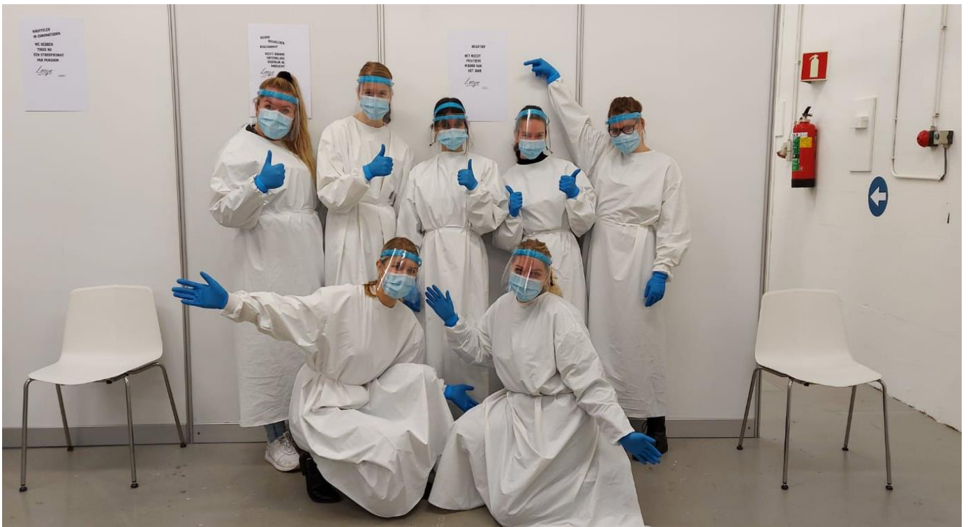
Deskundige assistenten 'bemannen' de COVID-19-teststraat. Een succesvol initiatief van Landstede Groep.